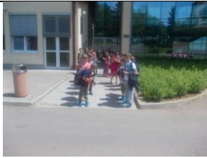
3. VITOMARCI – BERLAK KRIŽIŠČE