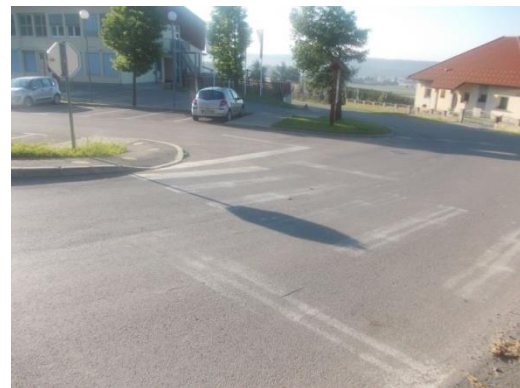
Edini prehod za pešce pri šoli