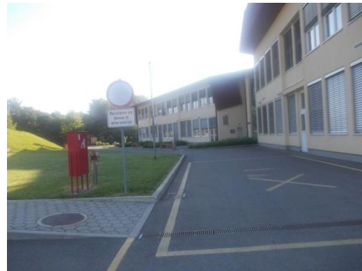
šolska dovezna pot