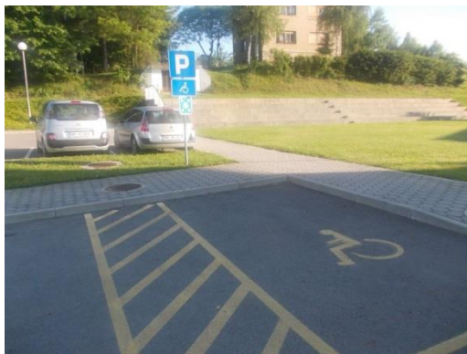
Parkirišče za invalide