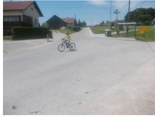
Zavijanje na glavno cesto