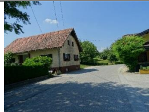
4. HVALETINCI – GLAVNO KRIŽIŠČE