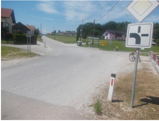
Bližnje križišče Berlak