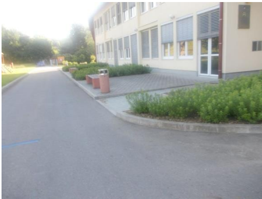
Dovozna pot k šoli